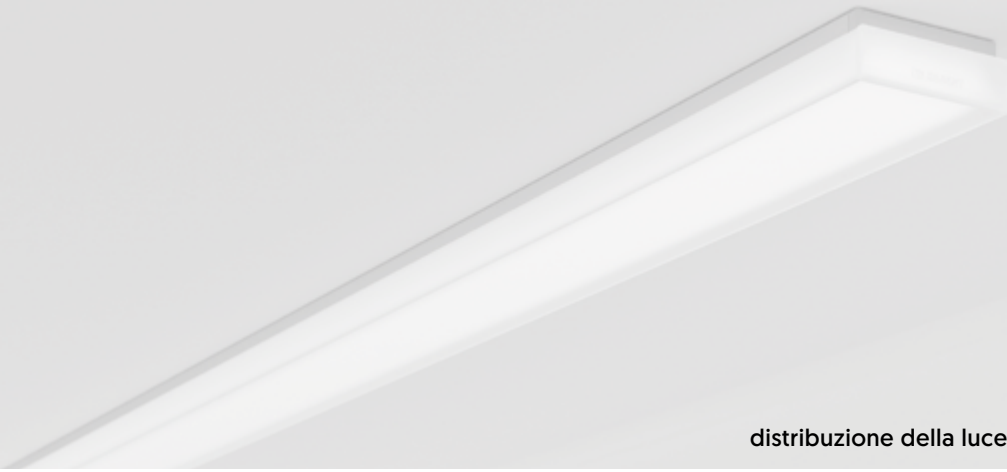
distribuzione della luce omnidirezionale