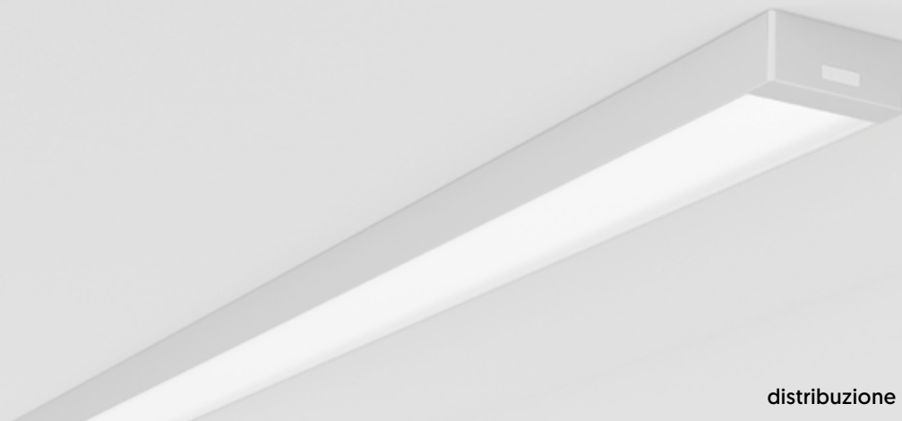
distribuzione della luce diretta