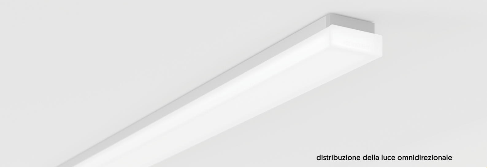
distribuzione della luce omnidirezionale